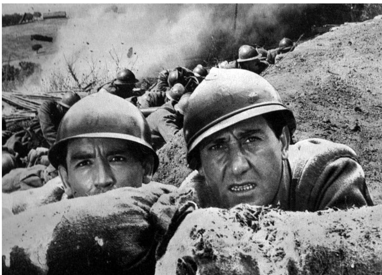
dal film : La grande guerra / Mario Monicelli 1959